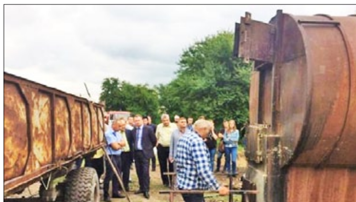
Рис. 9. «Технології» спалювання побутових відходів методом піролізу

Вітчизняні цементні підприємства, які можуть забезпечити високотемпературне спалювання твердих побутових відходів, не мають необхідних очисних фільтрів для вловлювання забруднюючих речовин. Для екологічно безпечного спалювання твердих побутових відходів необхідна висока температура — понад 1200 °С. Високі температури використовуються у технологічних процесах в Україні для виробництва цементу. Для спалювання ТПВ на цементних заводах, в першу чергу, необхідне попереднє сортування відходів. Відходи можуть прийматися на цементні заводи лише відсортованими, подрібненими без полівінілхлоридів.