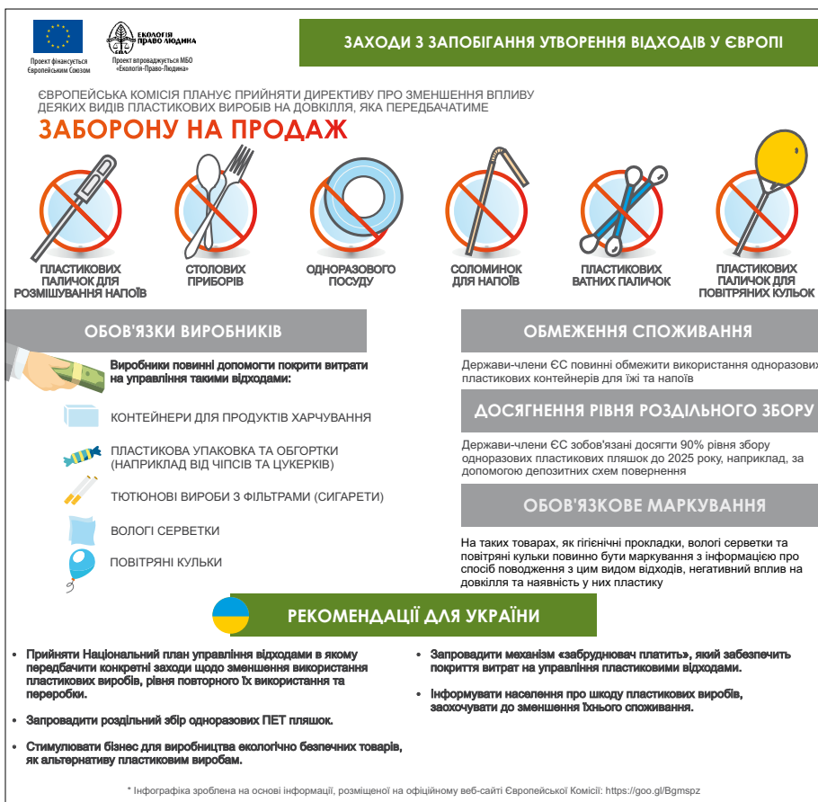
Рис. 4. Заборона одноразових пластикових виробів у Європі

всіх країнах — членах ЄС 8 . Також такі «мокрі» відходи не можна спалювати. До січня 2027 року біовідходи, які піддаватимуться аеробному чи анаеробному зброджуванню будуть вважатися такими, що були перероблені (recycled), якщо вони були окремо зібрані біля джерела їхнього утворення. У зв'язку із цим відокремлення органіки та її зброджування на заводах механіко-біологічної переробки (МБК) не буде вважатися переробкою органіки. У 2024 році Єврокомісія також має встановити цілі для муніципальних біовідходів та біовідходів від бізнесу 9 .