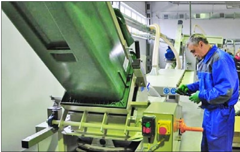
Рис. 5. Лінія з перероблення ВЛЛ ДП «Боднарівка»

вирішення проблеми з медичними відходами у Польщі діє принцип наближення, який говорить, що відходи повинні перероблятися максимально близько до місць їхнього утворення. В Україні ж підприємства, які мають ліцензії на перероблення клінічних та подібних їм відходів, а саме — відходів, що виникають в результаті медичного догляду, ветеринарної чи подібної практики, і відходи, що утворюються в лікарнях або інших закладах під час досліджень, догляду за пацієнтами або при виконанні дослідницьких робіт, розташовані лише у семи областях: Дніпропетровській, Запорізькій, Київській, Кіровоградській, Миколаївській, Одеській, Харківській.