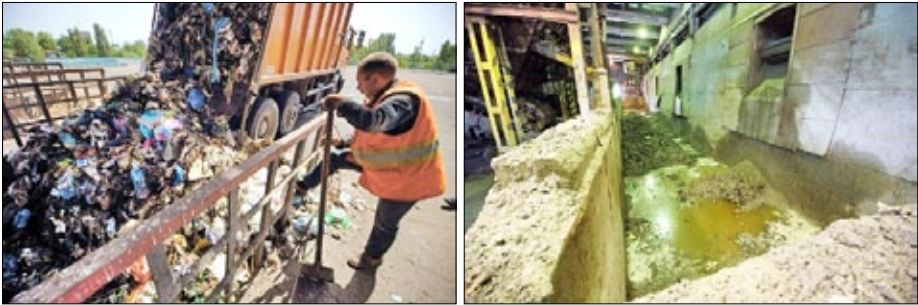
Рис. 8. Сміттєспалювальний завод «Енергія» у Києві

вів (рис. 8). Проте, завод не забезпечує високотемпературного спалювання відходів. Система очищення димових газів не відповідає європейським вимогам. Завод не здійснює моніторинг за викидами в атмосферне повітря діоксинів, фуранів та важких металів.