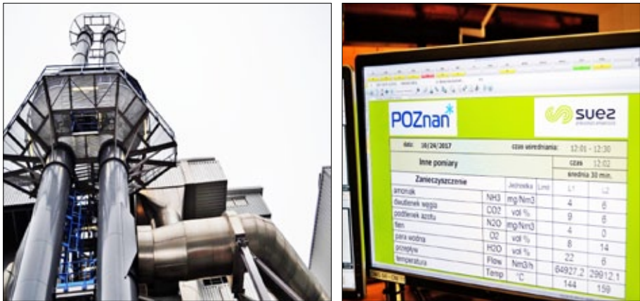
Рис. 7. Сміттєспалювальний завод у Познані

Все технологічне обладнання на сміттєспалювальному заводі фірми Hitachi Zosen Inova (Швейцарія). На етапі будівництва заводу визначалася морфологія відходів і на сьогодні при проведенні розрахунків використовуються усереднені дані. Потужність заводу — спалювання відходів у кількості 210 тис. тонн на рік. Сумарна енергетична цінність комунальних відходів, що потрапляють на завод протягом року, становить 267 тис. Гкал. Приймаються для спалювання змішані відходи. Сміттєсортувальної лінії на підприємстві та в цілому у системі управління відходами міста Познань немає. Відходи до моменту потрапляння в котел можуть складуватися в бункері 8–10 днів. Для економії енергетичних ресурсів в бункер подається повітря з температурою 200 °С, яке підігрівається за допомогою системи відведення продуктів згорання.