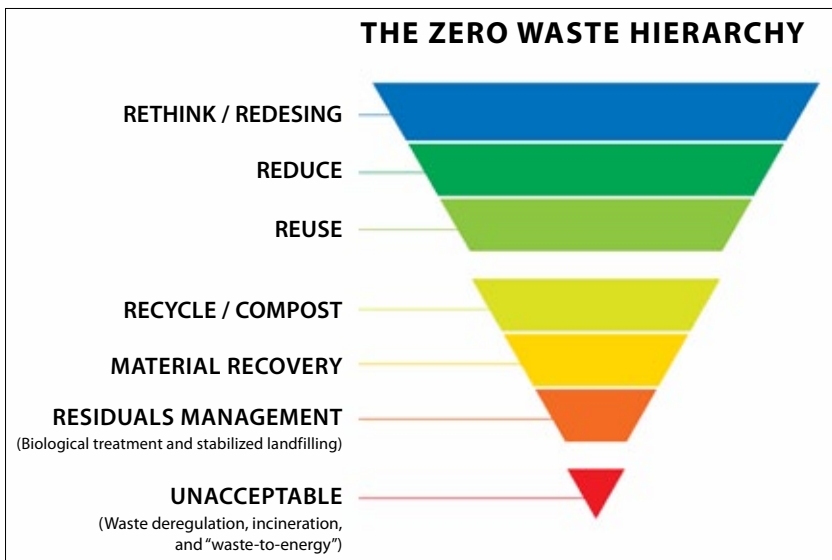
Рис. 2. Ієрархія управління відходами «Нуль відходів»

Члени асоціації також вирішили трохи доповнити ієрархію поводження з відходами, і додали ще один етап, який передує запобіганню утворенню відходів — це «перезавантаження» та зміна дизайну (rethink, redesign) (рис. 2).