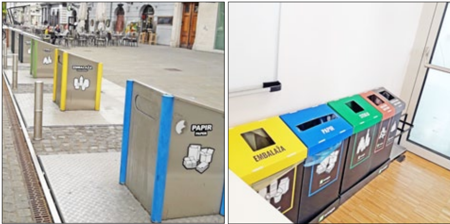
Рис. 10. Контейнери для роздільного збору відходів у Любляні

Жителі міста Любляни (Словенія) платять до 10 Євро щомісячно з одного домогосподарства, яке налічує умовно 2,2 людини 102 . Мешканці мають можливість викидати відходи до 5-ти різних контейнерів: змішані відходи, органічні відходи, упаковка, скло, папір (рис. 10). Всі відходи забирає місцева муніципальна компанія. Проте, лише за змішані та органічні відходи платить житель. Вивезення решти відходів покривається за рахунок продажу цих відходів як вторинної сировини та за рахунок дії системи «розширеної відповідальності виробника» (щодо упаковки), яка була запроваджена Директивою ЄС 2008/98/ЄС про відходи 103 . Доступ до загальнодоступних контейнерів для сміття забезпечується за допомогою електронної картки жителя. Мешканці індивідуальних будинків мають свої власні контейнери для відходів та сплачують за відходи в залежності від обсягів контейнерів.