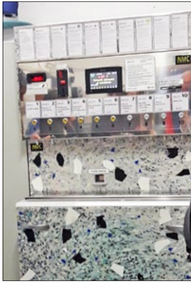
Рис. 3. Апарат для реалізації продукції у тару споживача

напоїв, одноразовий посуд, столові прибори, соломинки для напоїв, пластикові ватні палички, пластикові палички для повітряних кульок (рис. 4) 7 .