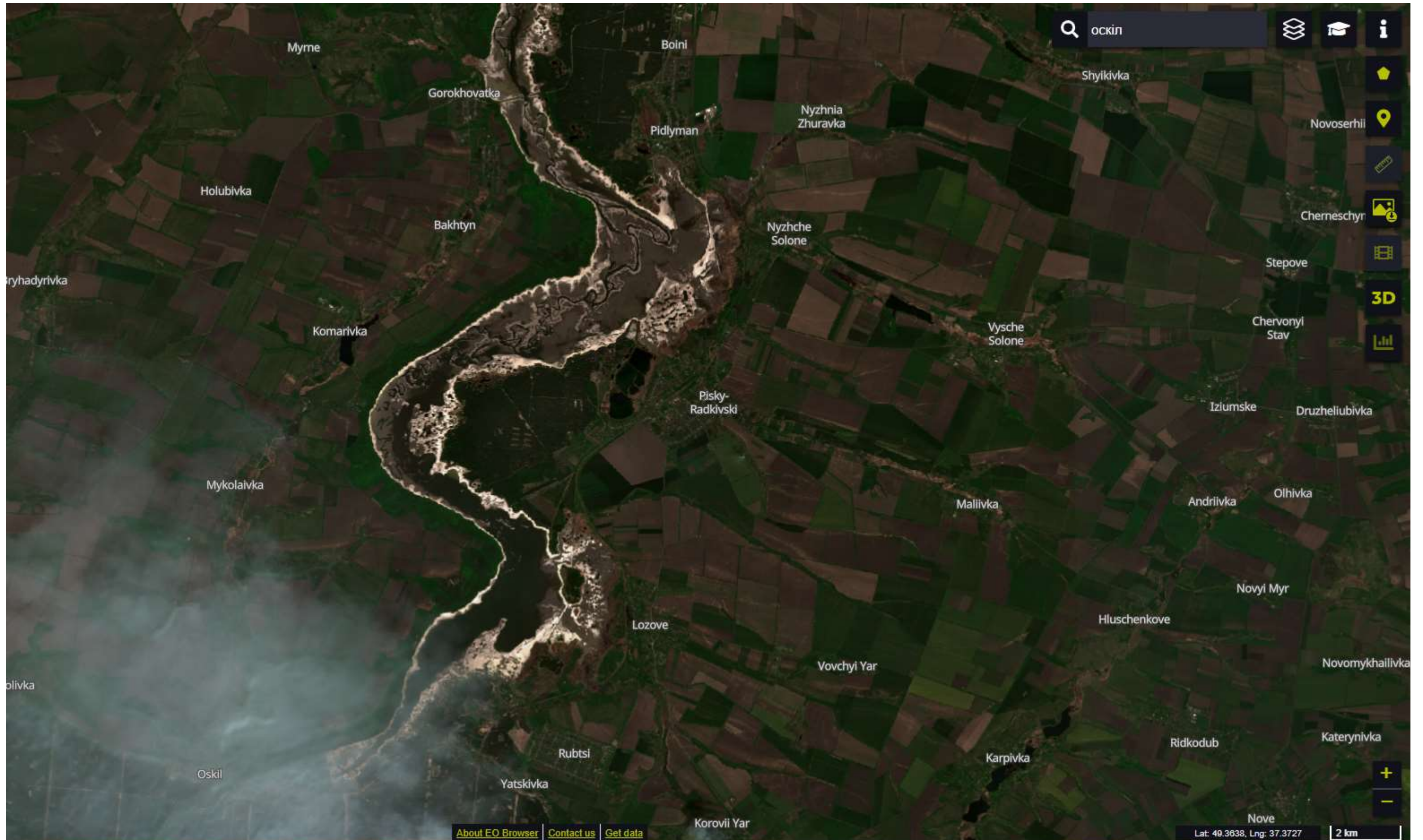
Майже порожнє Оскільське водосховище через 5 тижнів після підриву греблі – знімок за 08.05.2022