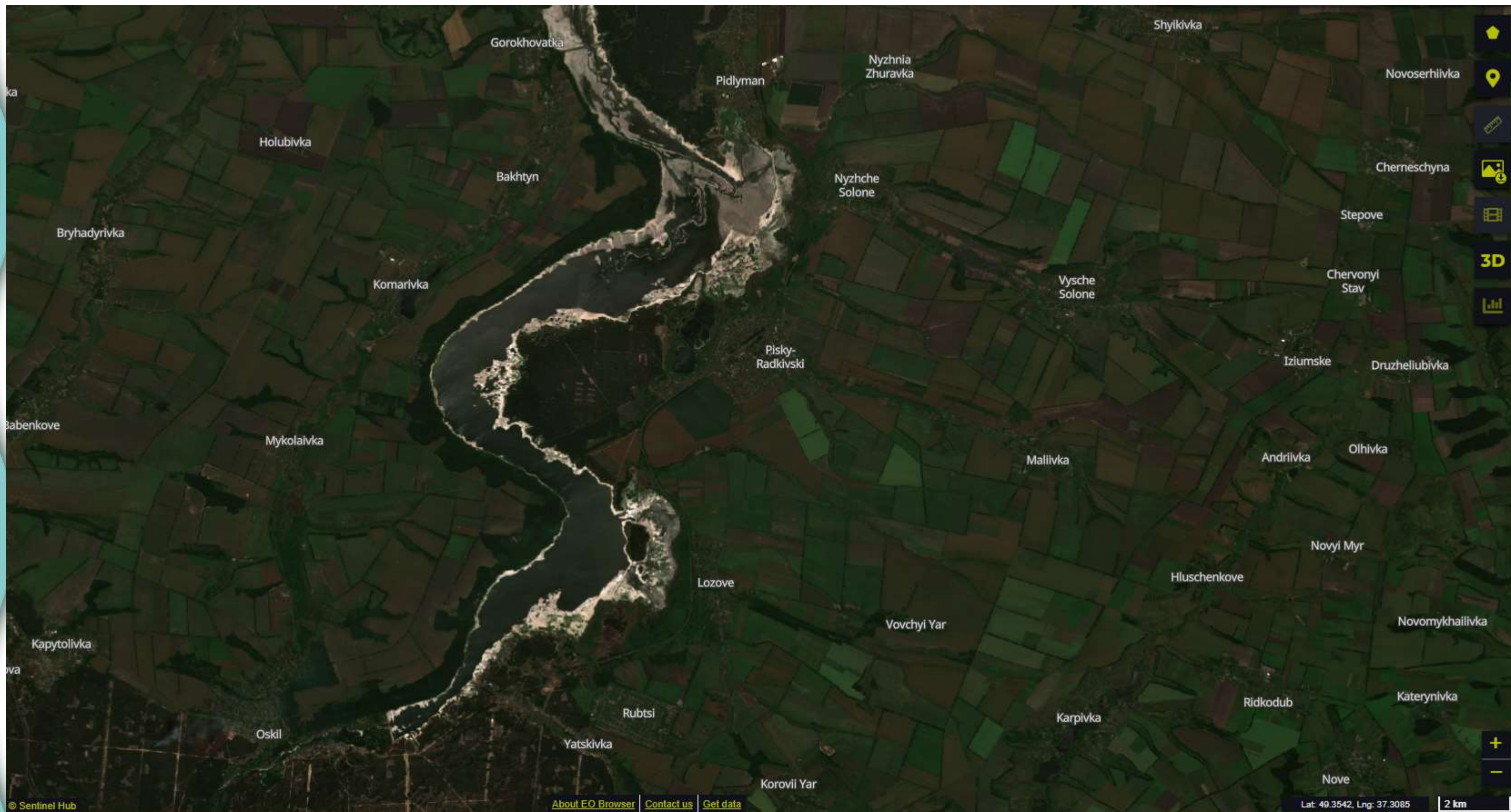
Повторне наповнення Оскільського водосховища – знімок за 20.06.2022