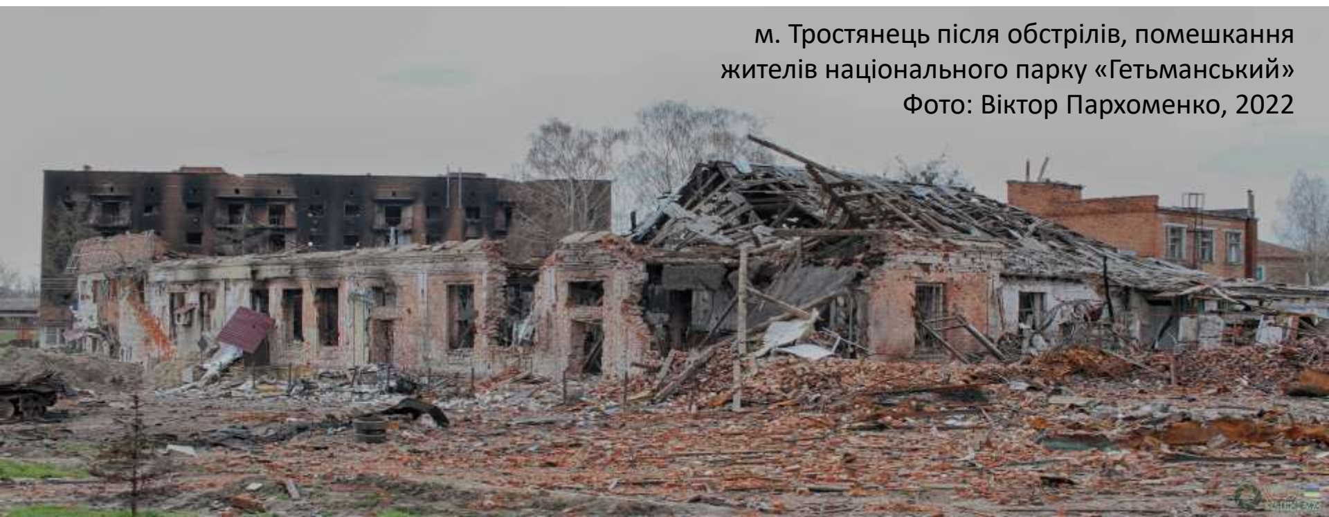
Фото: Віктор Пархоменко, 2022

м. Тростянець після обстрілів, помешкання жителів національного парку «Гетьманський»