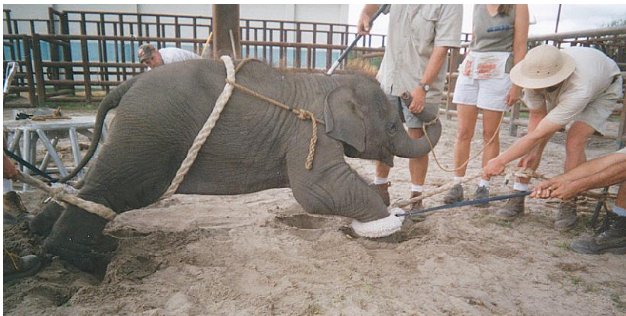
Фото з відкритих джерел 38 .

При дресируванні тварин використовують різні методи. Деякі з них полягають у заохочуванні тварини частуванням та прояві ласки і турботи з боку тренерів. Такі методи є гуманними та застосовуються переважно до домашніх видів тварин. Що ж стосується диких тварин, особливо хижих, для їх дресирування використовуються електрошокери, побої (зокрема, спеціальними палками з гаками 39 ), зв'язування, недогодовування, залякування, приниження та інші жорстокі методи (див. Рисунок 7) 40 . Через відчуття сильного болю тварина запам'ятовує про необхідність виконання того чи іншого руху – якщо вона виконає цей рух/трюк, болю заподіяно їй не буде. До прикладу, для того, щоб ведмеді стояли на задніх лапах, їх часто прив'язують таким чином, що вони змушені стояти саме в такій позі (див. Рисунок 8). Окремі тренери використовують наркотики для того, щоб тварини були більш керованими, спокійними. Крім того, хірургічним способом хижим тваринам видаляють зуби, кігті, щоб останні не могли заподіяти шкоду тренерам 41 .