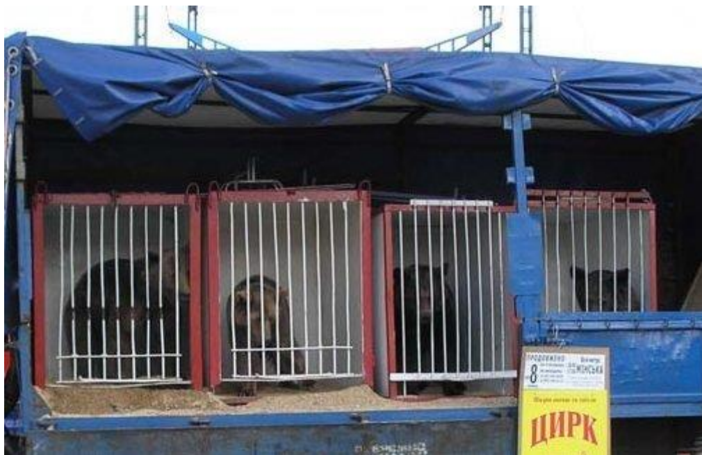
Фото з відкритих джерел 31 .

У цирках використовують молодих тварин, яких тренують з раннього віку. Однак не всі вони доживають до старості. Зокрема, окремі випадки утримання тварин в незадовільних умовах призводить до передчасної смерті тварин. Так, 4 жовтня 2017 року під час гастролей цирку «Кобзов» у Рівному помер жираф 32 . Під час гастролей «Великого будапештського цирку» помер 5-річний жираф, а також лев 33 . Тварин, які не можуть брати участь у шоу через старість чи хвороби, утримують у клітках на території цирків або продають у зоопарки, на мисливські станції, у розважальні заклади, ресторани комплекси тощо. Трапляються також випадки забою таких тварин для годівлі тих, що утримуються у цирках 34 .