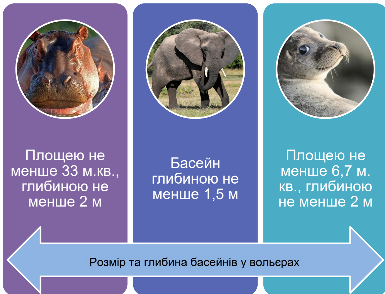
Рисунок 3. Мінімальні розміри басейнів для утримання диких тварин.

Рисунок підготовлено авторами на основі даних законодавства 27 .