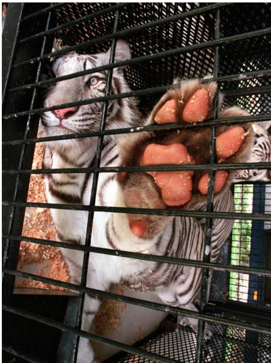
Рисунок 4. Умови утримання диких тварин в цирках.