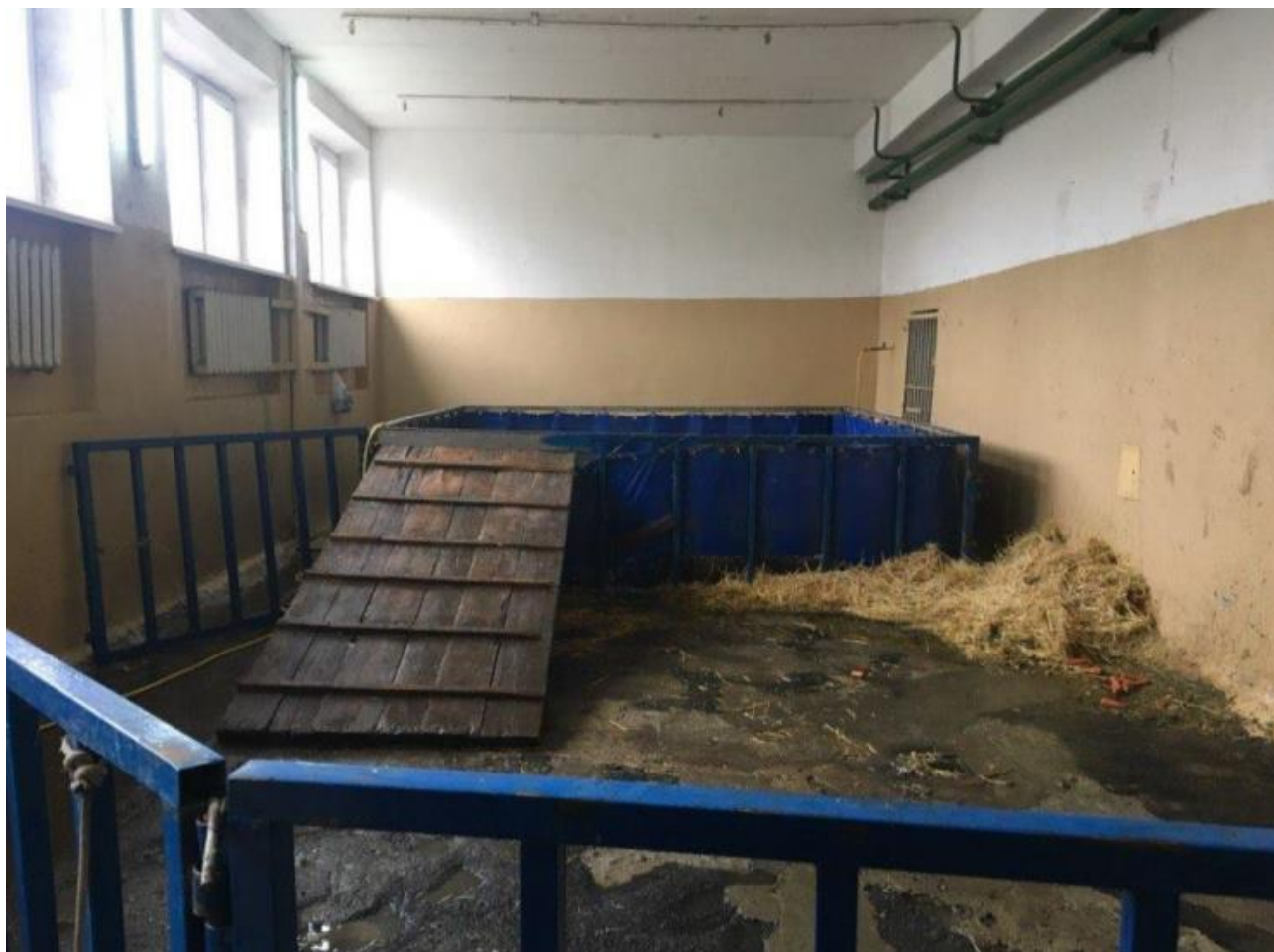
Рисунок 5. Басейн та вольєр для утримання бегемота пересувного цирку.